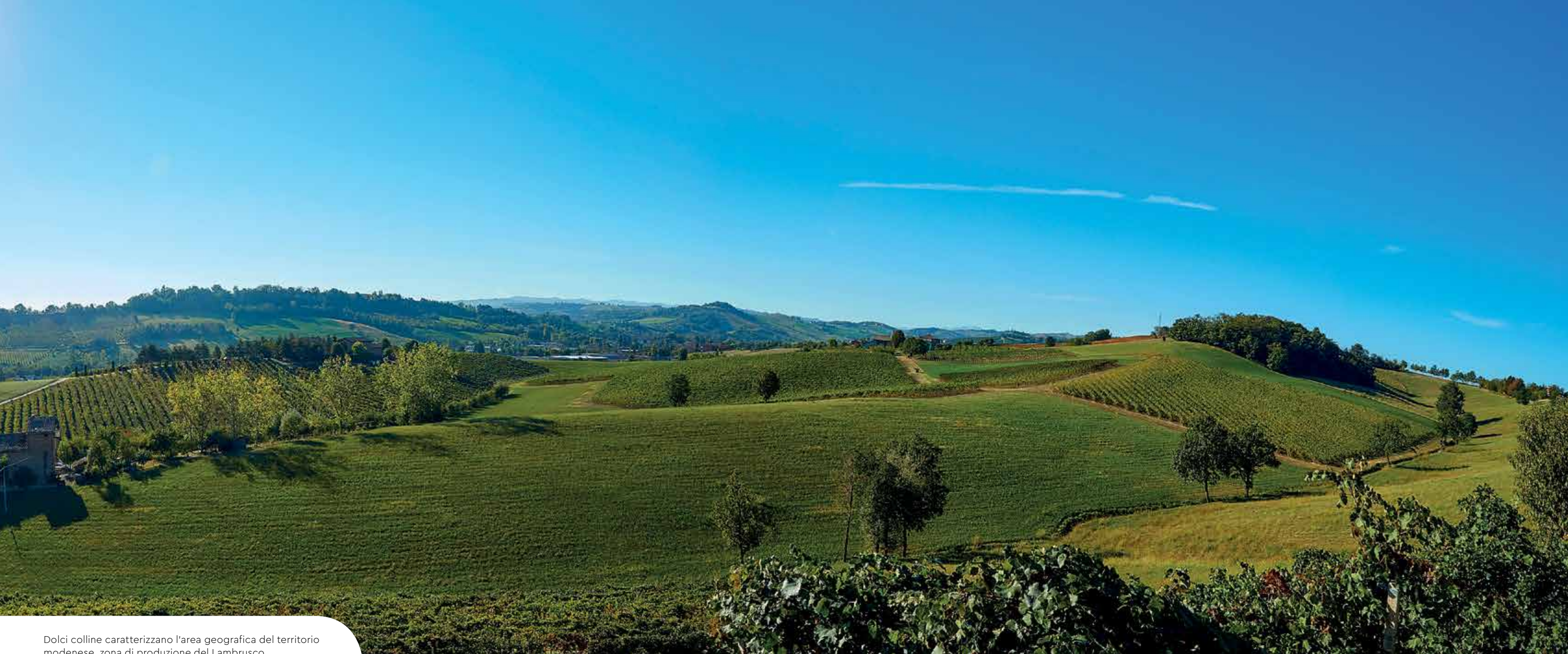
Dolci colline caratterizzano l'area geografica del territorio modenese, zona di produzione del Lambrusco.

processo trasformativo lunghissimo, sia grazie ai detriti trasportati dal fiume Po sia a causa della spinta fra due diverse placche territoriali, l'area geografica ha mutato aspetto, dando origine al paesaggio odierno.