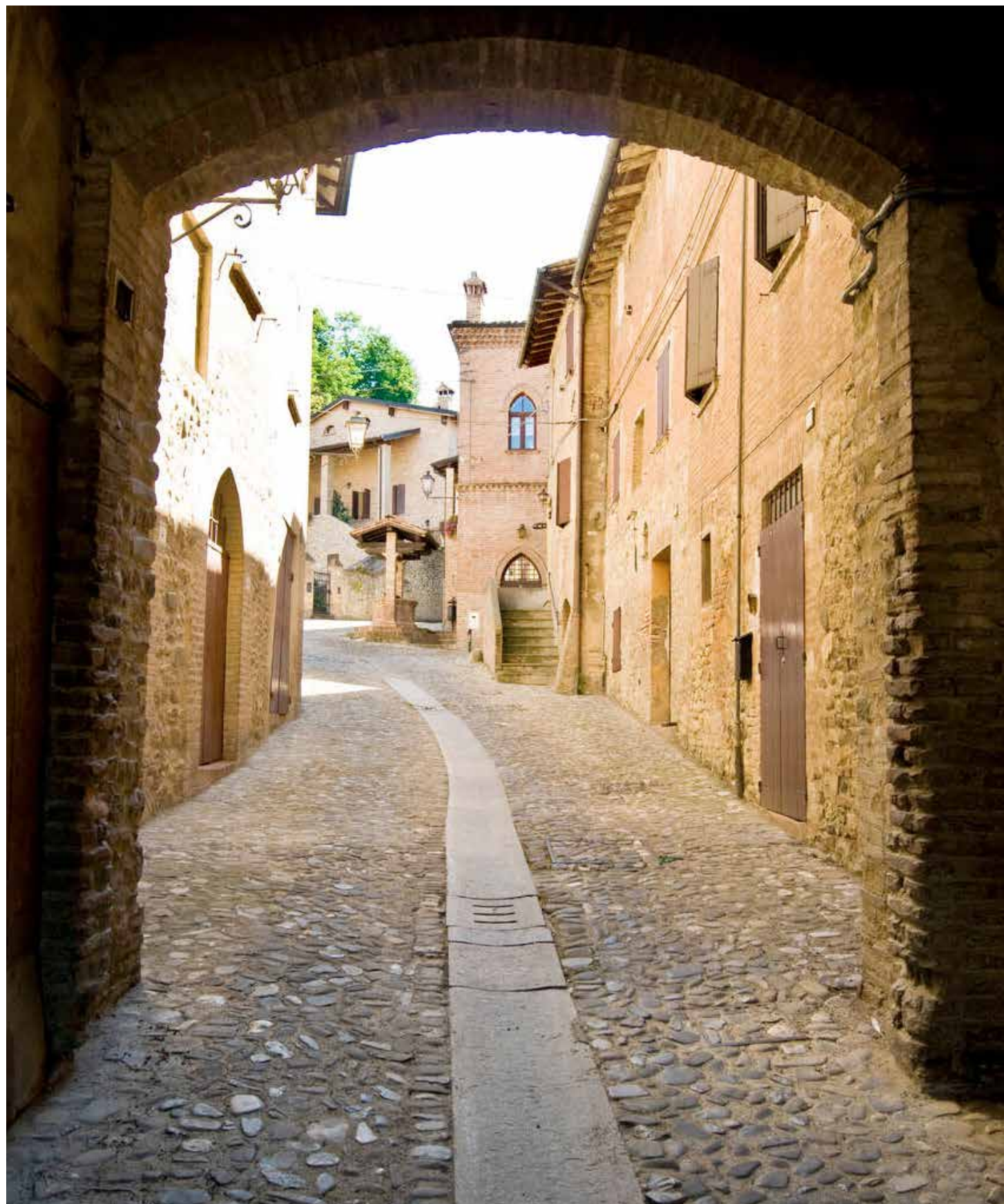
A sinistra, uno scorcio del borgo medievale di Savignano sul Panaro. A destra, la Venere di Savignano .