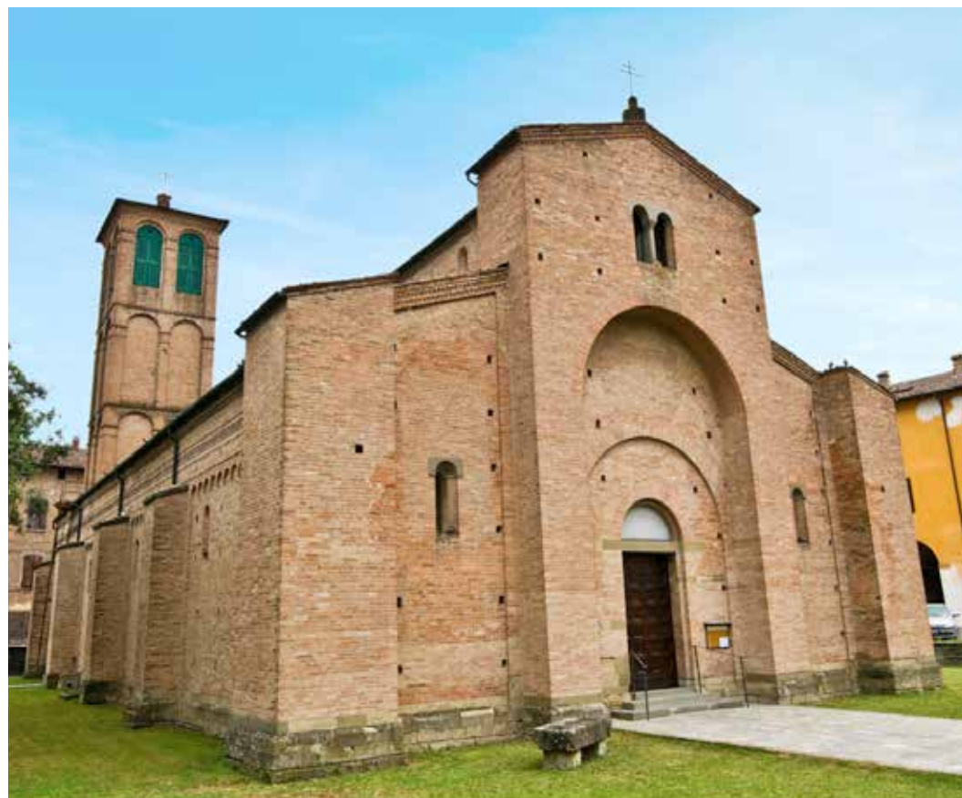
La Basilica di San Cesario nell'omonimo paese sul fiume Panaro.

ce, mentre ben presente è la Basilica, dedicata a san Cesario, la cui fondazione risale al V-VII secolo d.C. Ampliata nel Duecento, grazie anche all'intervento della potentissima e onnipotente contessa Matilde, e danneggiata da un incendio nel 1348, si dota di un campanile nella seconda metà del Cinquecento. Nel XVII secolo l'aspetto esteriore viene completamente stravolto da una serie di interventi destinati a ricoprire le strutture romaniche, inaccettabili per l'estetica dell'epoca. Soltanto a partire dal 1945 – e fino al 1966 – si svolgono gli imponenti lavori di restauro che restituiscono la splendida struttura originaria in puro stile romanico. L'esterno è in cotto, impreziosito da archetti pensili, contrafforti laterali e alcune disposizioni particolari (nella parte alta delle fiancate) di mattoni a losanga o "a dente di sega"; la facciata principale tripartita è armonicamente sobria e il portale è incorniciato da una serie di archi a tutto sesto digradanti, mentre le tre absidi semicirculari scandiscono all'esterno la disposizione dei volumi. Il maestoso interno è suddiviso in tre navate da una serie di possenti colonne sormontate da capitelli romanici riccamente decorati a bassorilievo; la luce filtra dalle finestre monofore strombate che si aprono nelle pareti laterali, ma lo sguardo del visitatore è attirato verso l'abside centrale, rivolta a est e illuminata da tre grandi aperture.