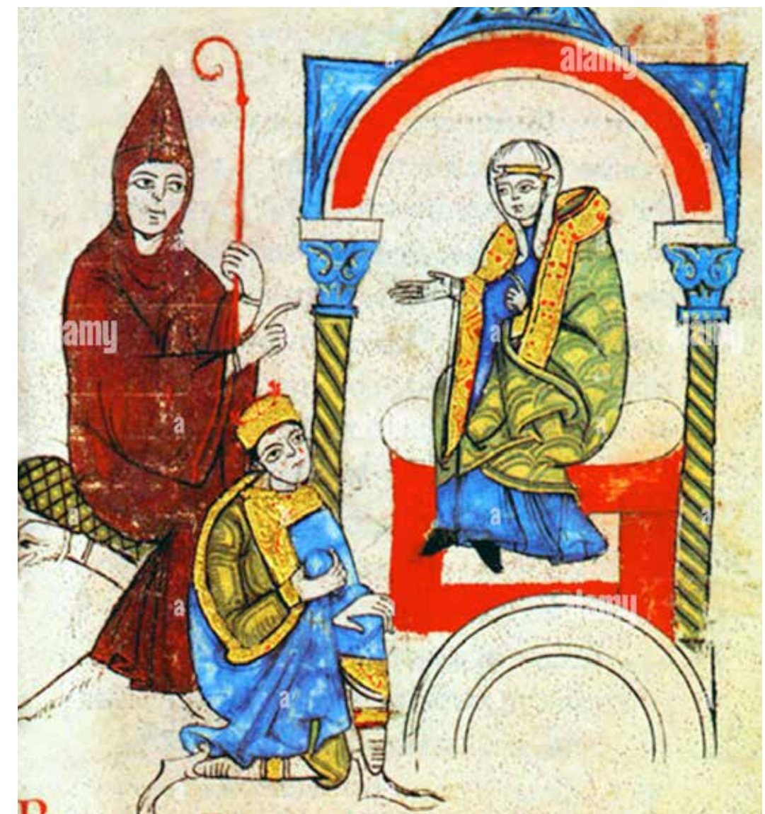
Nella foto a sinistra, il Castello di Canossa. Nella foto a destra, codice miniato medievale raffigurante Enrico IV penitente davanti a Ugo di Cluny e Matilde di Canossa

Il Castello di Canossa è parte di un sistema difensivo ben organizzato, che trova nelle fortezze di Rossena e Rossenella gli altri centri collegati. La prima, appartenuta anch'essa alla famiglia di cui faceva parte Matilde, era stata co-