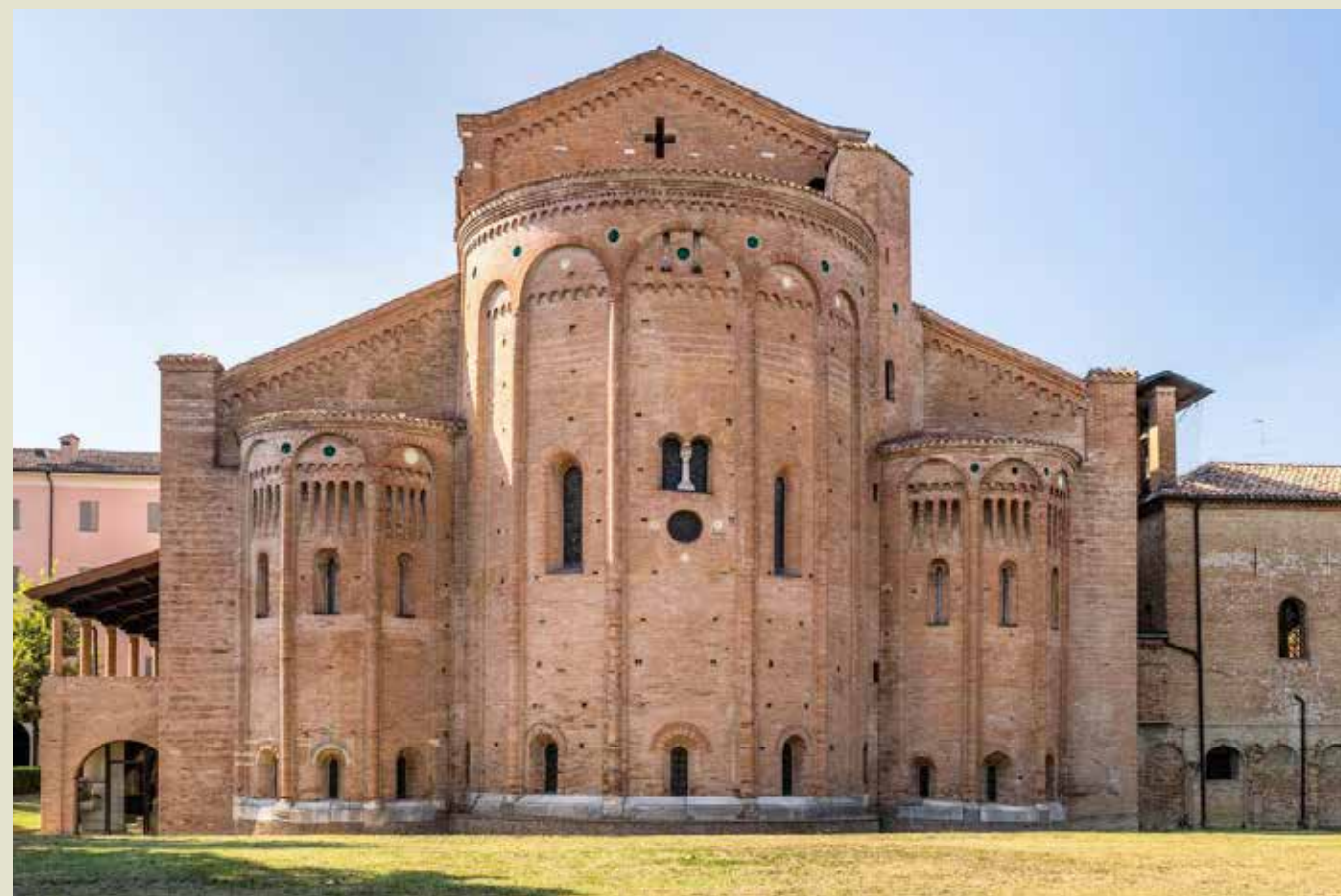
A sinistra, l'esterno dell'Abbazia. Sopra, la cripta.

carolingi. Durante questo periodo l'Abbazia conosce un grande sviluppo e si dota di uno scriptorium , un laboratorio in cui i monaci copiano o creano manoscritti meravigliosamente decorati: a Nonantola ne furono prodotti almeno duecentocinquantanove, di cui solo tre sono gelosamente conservati in loco , mentre gli altri sono sparsi per le biblioteche italiane ed europee.