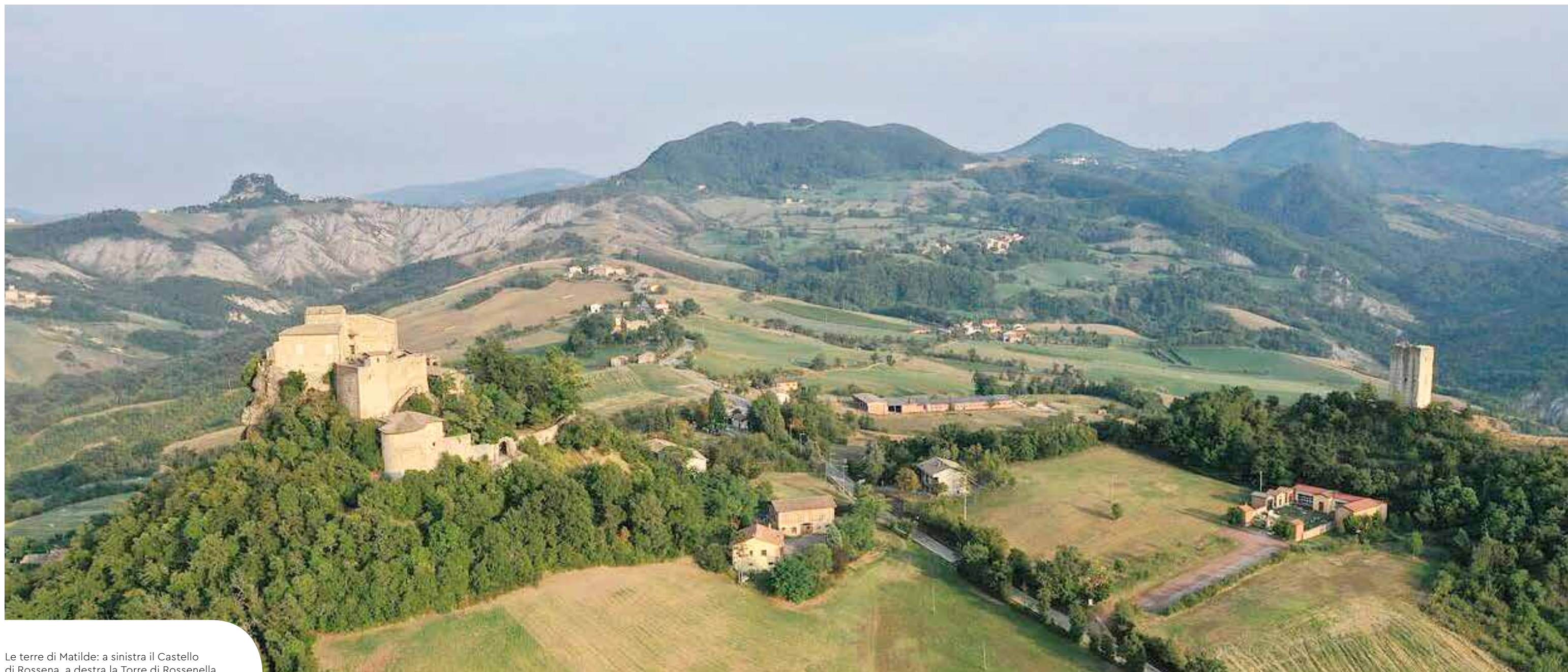
Le terre di Matilde: a sinistra il Castello di Rossena, a destra la Torre di Rossenella.

struita dal bisnonno della contessa intorno al 950 circa; meravigliosamente conservata, permette di comprendere pienamente la struttura del dominio canossiano, in cui il castello della contessa era il centro politico e la sede del potere, mentre Rossena e Rossenella ne erano gli avamposti militari, strategicamente affacciati sulle vie di comunicazione che si snodavano lungo la valle del fiume Enza.