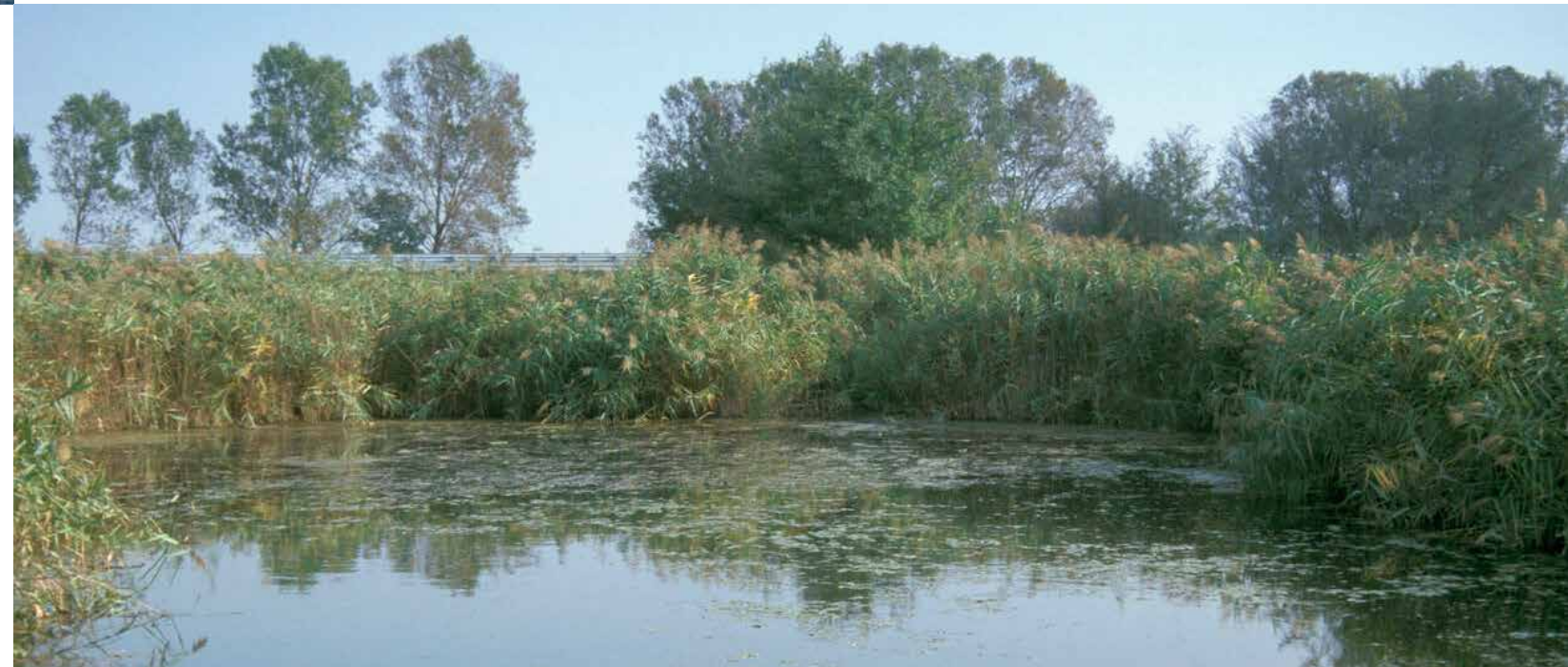
Il fiume Secchia vicino a Castelnovone' Monti, in territorio reggiano.

La sorgente e il corso superiore del Secchia si trovano in un'area geografica che registra un livello di precipitazioni particolarmente elevato; il conseguente innervamento che caratterizza il suo alto bacino per molti mesi dell'anno fa sì che il fiume si distingua dagli altri affluenti del Po per la copiosità del suo apporto nella stagione primaverile.