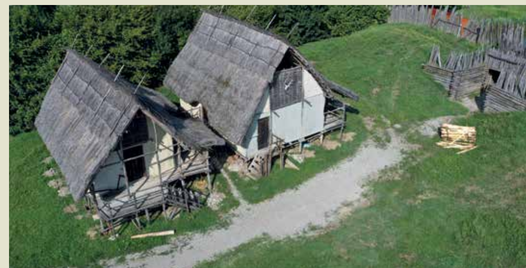
Il Parco Archeologico di Montale offre ai visitatori la possibilità di ammirare la ricostruzione di tipici villaggi dell'età del Bronzo, risalenti a una civiltà sviluppatasi nelle aree di pianura dell'Emilia.

Il caso di Poviglio non è isolato: in provincia di Modena, vicino a Castelnuovo Rangone, si trova il Parco archeologico di Montale. Qui, accanto alle aree di scavo, sono state ricostruite alcune terramare, cioè i villaggi, per offrire ai visitatori la possibilità di immergersi nella vita quotidiana degli uomini preistorici.